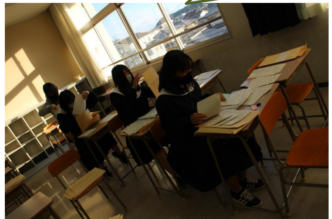
アンケートの事前準備・事後分析

自主的に、蔭でみなさんをアシストしてくれている仲間がいます！配布物の準備やアンケートの確認、掲示物の工夫など、皆さんの授業が少しでもスムーズにいくように頑張っています。引き続きよろしくお祈りします。