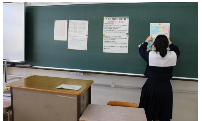
掲示物の確認・ジクソー振り返りの準備