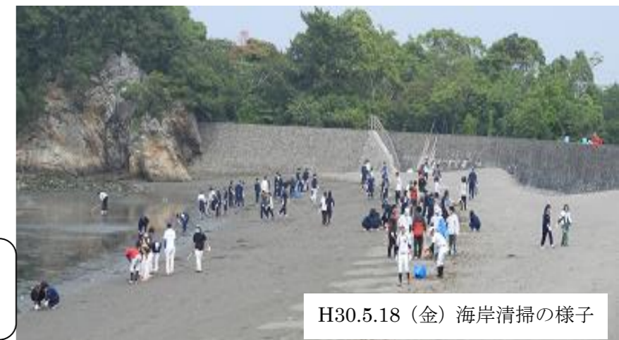
H30.5.18(金) 海岸清掃の様子

進路実現や充実した高校生活を送るためには、基本的な生活習慣を確立することが必要です。早寝・早起き・朝ご飯+学習時間を固定させることにより、生活リズムがよくなり、学習や部活動の成果も上がります。朝のあいさつを元気よく笑顔ですることにより、自分だけでなく周りの人にも気持ちよさや元気を出させます。美しく制服を着こなし頭髪をととのえることにより、地域の人たちからの信頼が得られます。お子様を社会の一員として必要とされる大人に成長させるために、御家庭でも御指導のほどよろしくお願いいたします。