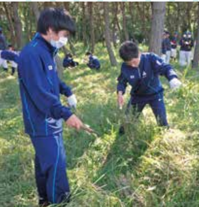
松原ボランティア