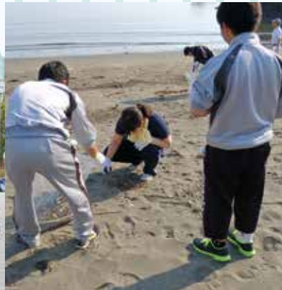
リフレッシュ 瀬戸内海岸清掃